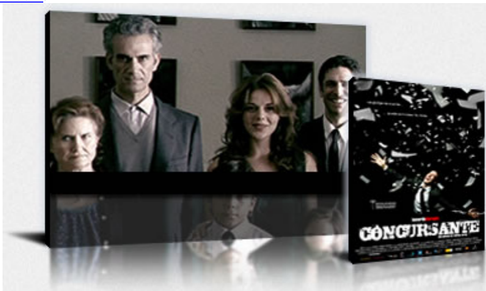
La oferta “más atractiva” de Filmotech.com

Nunca he escuchado a los productores españoles lanzar estos productos con entusiasmo. Tampoco en ferias, y he acudido a algunas. Por ejemplo, en el inicio de este fenómeno en el American Film Market de Santa Mónica California, en 2007 se lanzó el portal Hulu.com .